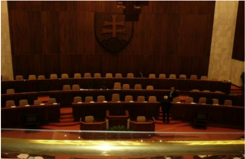
Obrázok č. 1 NR SR