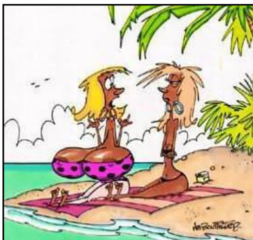
Neviem, prečo sa mi nikdy neopália nohy!