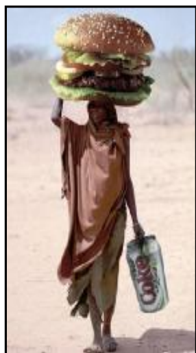
Situácia v Mogadišu stabilizovaná...