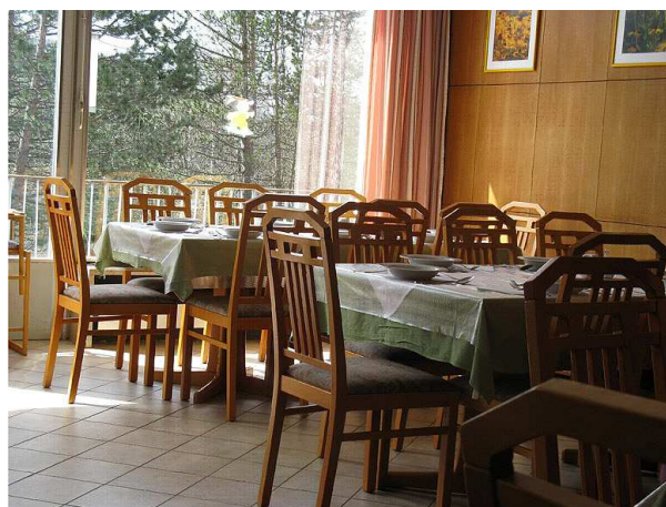
Švédske stoly vo veľkej jedálni